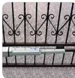
Ejemplos de instalación