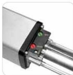
Regulación de la fuerza de empuje en apertura y cierre