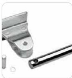
Ataque vástago en acero